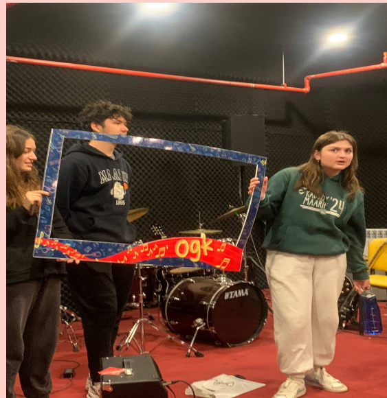
Clubul de muzica (Music club)